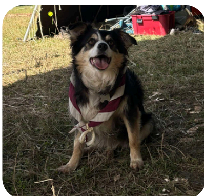
FIDJI (LE TOUTOU)