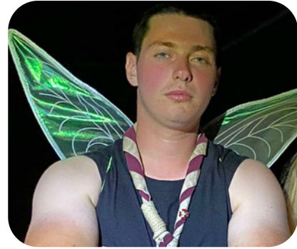
ANHINGA EREBOR (CYRIL LIGOT)